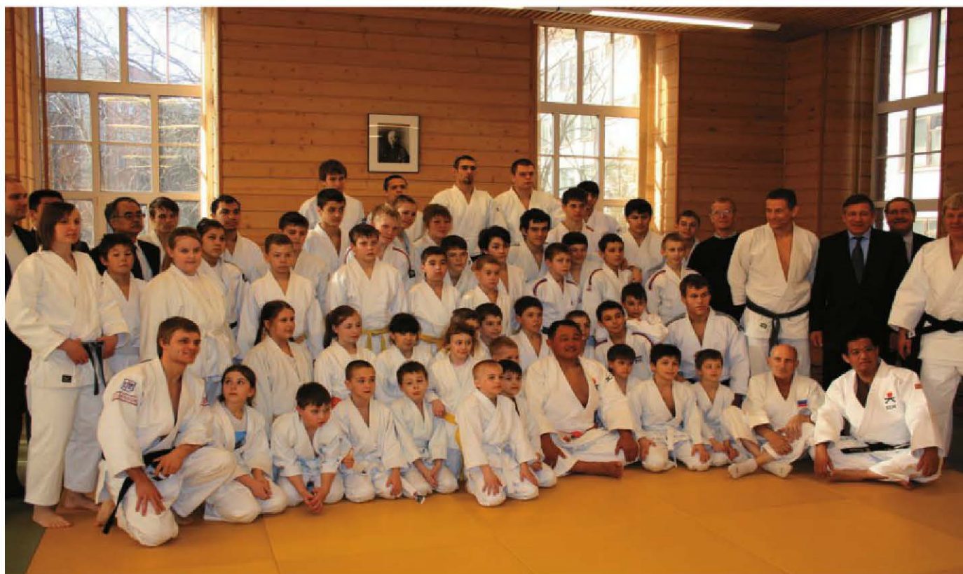
2013 год. Фото на память после мастер-класса с олимпийским чемпионом Ясухиро Ямасита

14 июля 1929 года рядом с заводом был торжественно открыт Выборгский стадион имени Красного спортивного интернационала (КСИ). На площади в пять гектаров разместились два футбольных поля, беговые дорожки, площадки для игры в теннис, волейбол, полоса препятствий, спортивные залы, раздевалки и душевые. На футбольных матчах одновременно могли разместиться на трибунах восемь тысяч болельщиков. В цехах и отделах были созданы