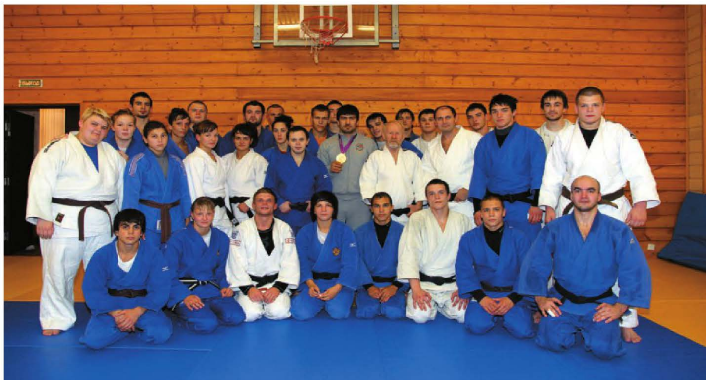
2012 год. Теперь в клубе есть олимпийский чемпион Тагир Хайбулаев