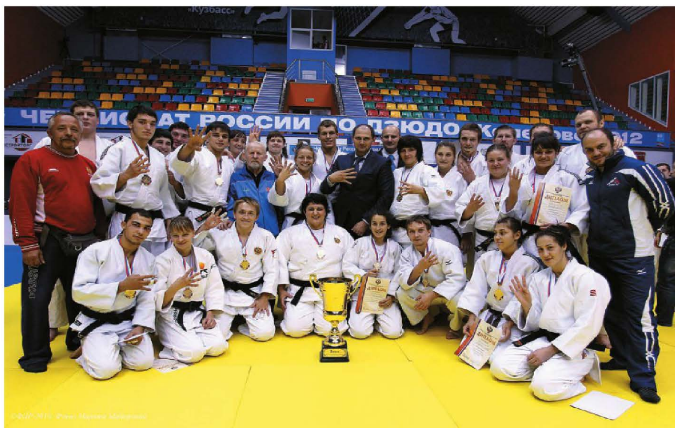
2012 год. Сборная команда Санкт-Петербурга по дзюдо в четвёртый раз победила в командном чемпионате России

6 апреля 1996 года на Зимнем стадионе впервые стартовал Международный фестиваль детского дзюдо. Впервые в стране начал проводиться такой грандиозный детский спортивный форум, ко-