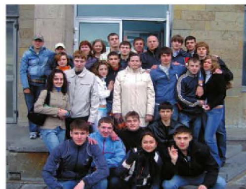
Сегодняшние и завтрашние чемпионы