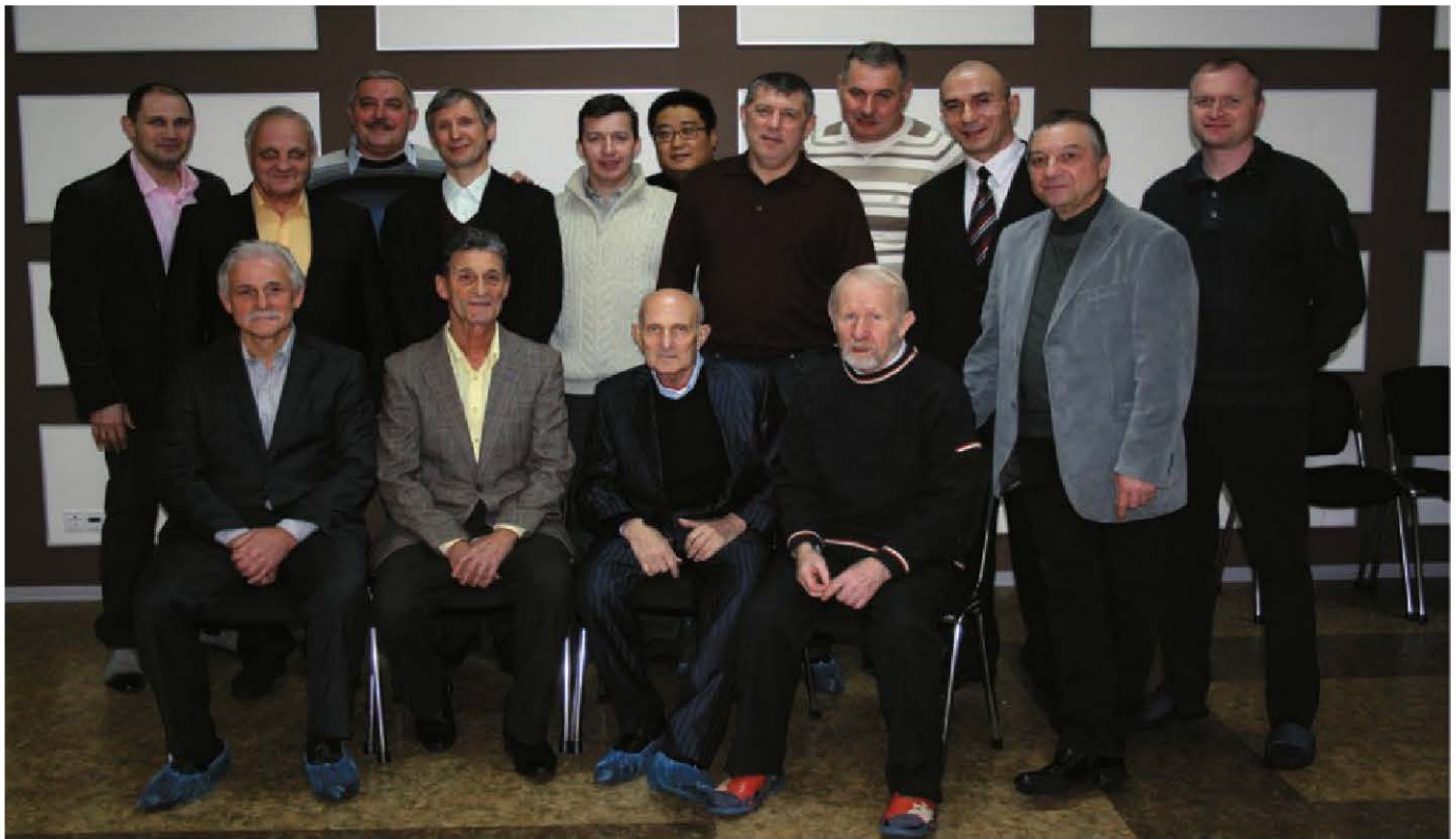
Они были первыми. Ветераны клуба дзюдо «Турбостроитель» с тренерами

сборщиком 3 разряда в механосборочный цех Ленинградского Металлического завода.