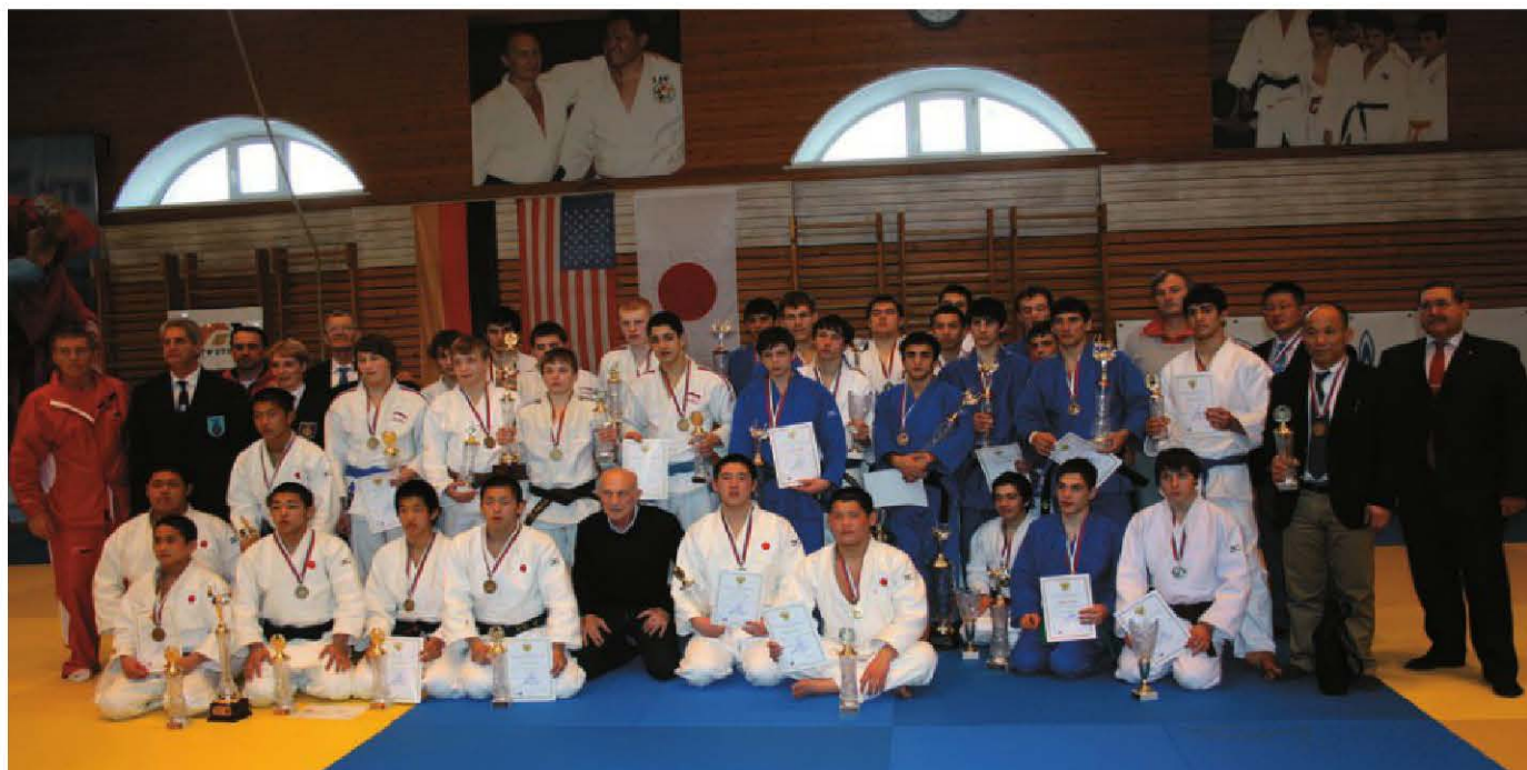
С наградами турнира

После окончания семи классов Токсовской школы он поступил в ФЗУ, окончил его в 1939 году и поступил на работу слесарем-