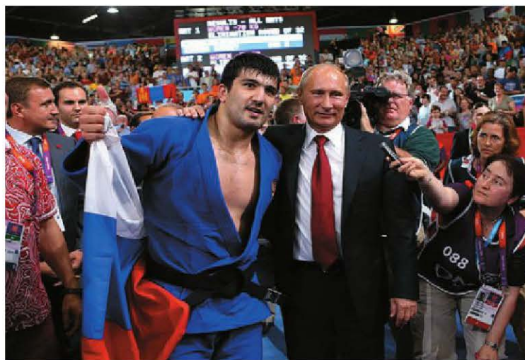
Первым поздравил олимпийского чемпиона Тагира Хайбулаева Президент России В.В. Путин