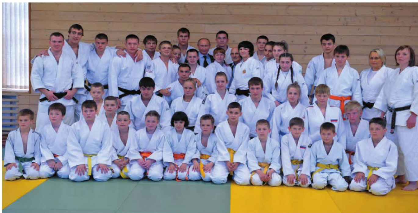
В свой клуб приехал Президент России В.В. Путин