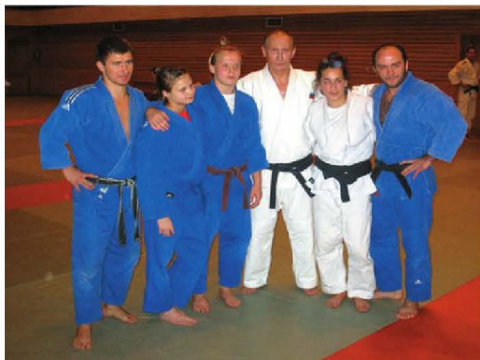
Президент России В.В. Путин на тренировке в КШВСМ